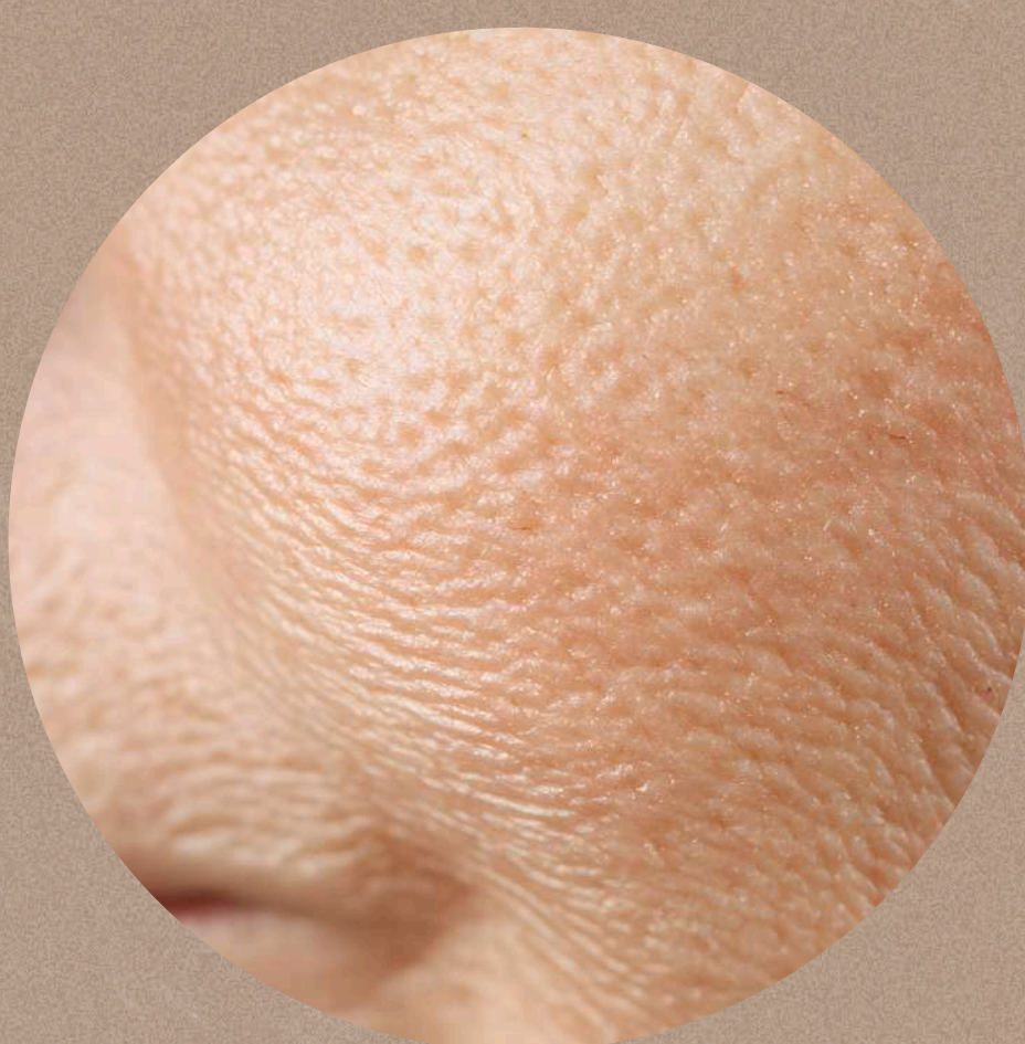
piel apagada y envejecida